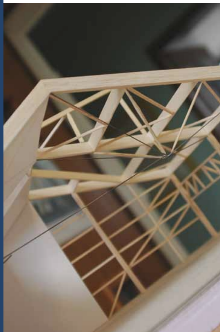
Réalisation : service communication - Insa de Strasbourg - décembre 2009.