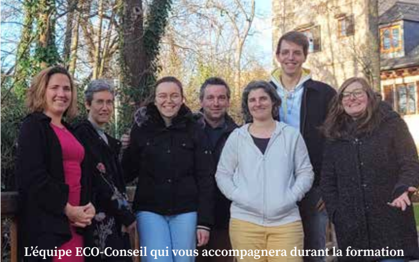
L'équipe ECO-Conseil qui vous accompagnera durant la formation