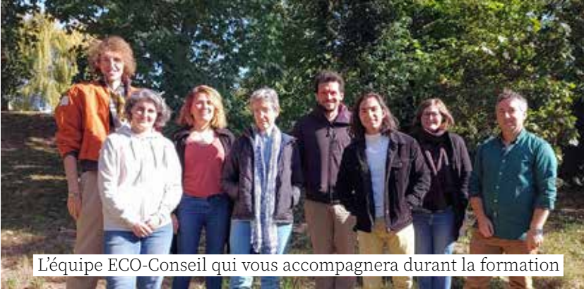
L'équipe ECO-Conseil qui vous accompagnera durant la formation